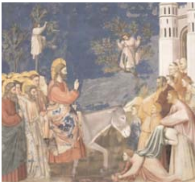
L'ingresso di Gesù a Gerusalemme di Giotto, Cappella degli Scrovegni a Padova