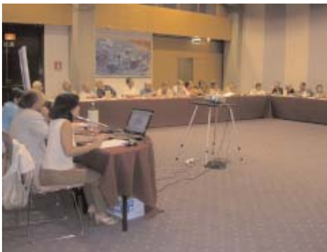
Delegati al 2° Congresso Nazionale Snadir

n o s t r o contributo per la soluzione di questioni che emergevano dall'applicazione della legge 53/2003, legge di riforma del s i s t e m a scolastico. In p a r t i c o l a r e vorrei segnalare la nostra i m p o r t a n t e