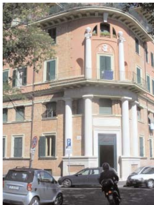
A pochi passi da Termini, al primo piano di questo palazzo si trova la sede Snadir di rappresentanza a Roma

La segreteria nazionale, pur non avendo sul territorio romano personale disponibile a cercare una sede adeguata, si è impegnata in una ricerca certosina, ed è riuscita a trovare una sede, riteniamo adeguata, per l'attività di rappresentanza a Roma.