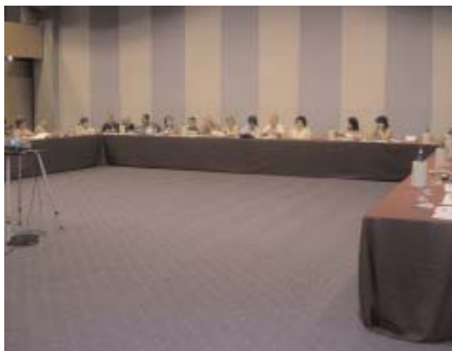
Delegati al 2° Congresso Nazionale Snadir

Tale decisione risulta ancora più incomprensibile a seguito degli orientamenti espressi dalla Corte dei Conti in occasione della registrazione del provvedimento relativo al primo contingente di 9.229 docenti; per la Corte, infatti, non occorre la verifica del provvedimento da parte della stessa in quanto "non tocca l'organico dei docenti di religione a suo tempo stabilito, né la relativa spesa"; pertanto risulterebbe possibile già da settembre 2005 l'immissione in