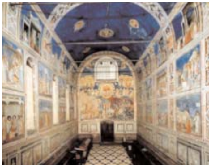
Cappella degli Scrovegni a Padova

Iscriviti alla Newsletter dello Snadir se vuoi ricevere direttamente nella tua casella di posta elettronica gli aggiornamenti dello Snadir