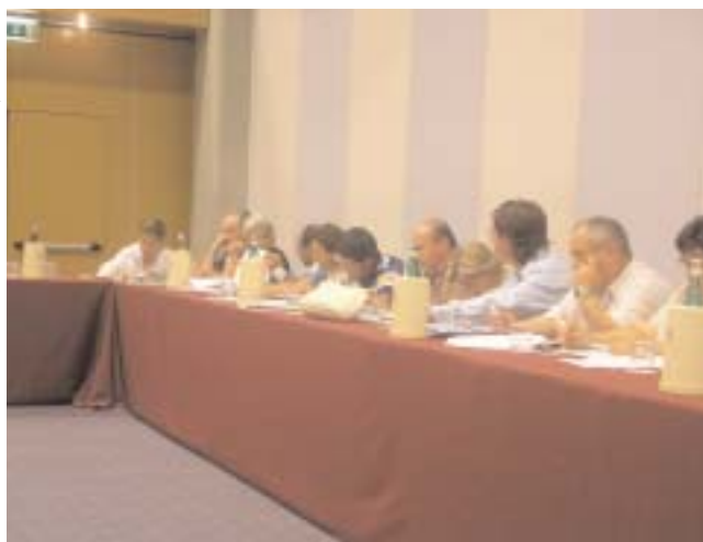
Delegati al 2° Congresso Nazionale Snadir

questo problema possa venire dal potenziamento dei siti regionali, che dovranno diventare un vero e proprio punto di riferimento per