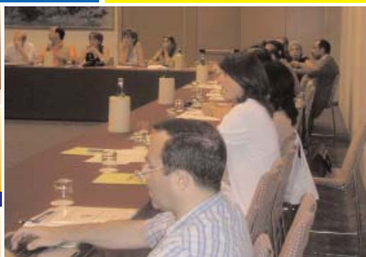
Delegati al 2° Congresso Nazionale Snadir

Come saranno questi nuovi licei? Riforma da rivedere per sindacati, regioni e imprenditori pag. 10