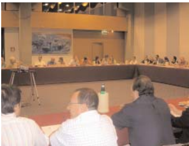
Delegati al 2° Congresso Nazionale Snadir

d e g l i insegnanti di r e l i g i o n e dell'Eftre, della Fercat e dell'Ela che ci h a n n o richiesto un c o n f r o n t o perché questo diritto si estenda anche ad altri docenti di religione europei.