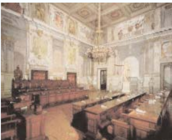
Consiglio di Stato - Palazzo Spada Sala di Pompeo

Al via le immissioni in ruolo degli Insegnanti di religione Il Miur accoglie le richieste dello SNADIR pag. 3