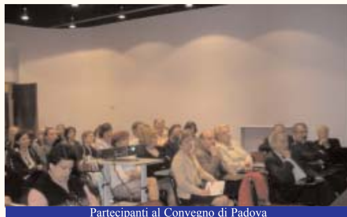
Partecipanti al Convegno di Padova

Iscriviti alla Newsletter dello Snadir se vuoi ricevere direttamente nella tua casella di posta elettronica gli aggiornamenti dello Snadir